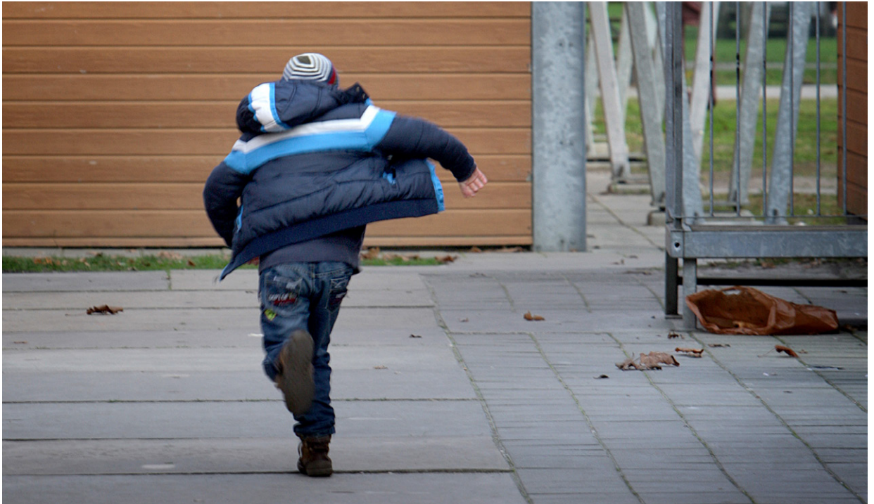
Ministerie van Veiligheid en Justitie