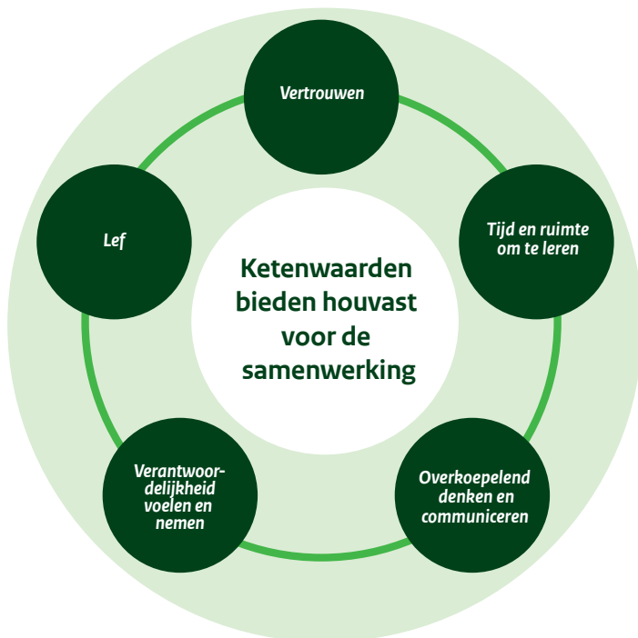
Figuur 2: Ketenwaarden bieden houvast voor de samenwerking in de keten