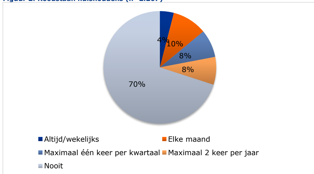
Figuur 2: Roodstaan huishoudens (n=2.267)

Van de respondenten die aangeven nooit rood te staan, zegt 48 procent wel rood te kunnen staan, 26 procent kan niet rood staan en 27 procent weet dit niet. Respondenten die niet rood kunnen staan hebben daar overwegend zelf voor gekozen (81 procent). Voor een klein deel (10 procent) geldt dat de bank daar geen toestemming voor geeft.